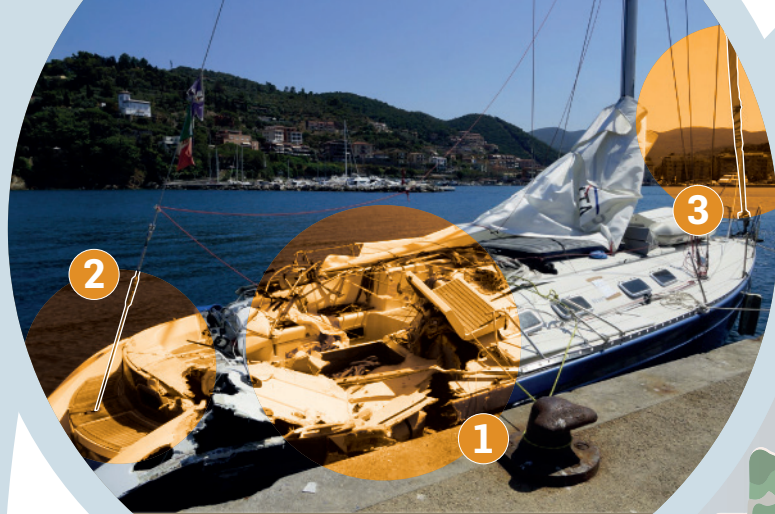
La barca a vela